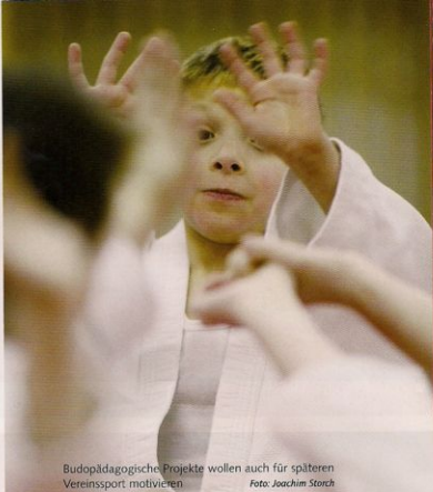
Budopädagogische Projekte wollen auch für späteren Vereinsport motivieren

Ein Mädchen mit Mutismus (Sprachlosigkeit gegenüber Fremdpersonen) sah mich zum ersten Mal in der Halle im Judoji. Sie kam spontan auf mich zu, nahm meine Hände und fragte mit flüsternder Stimme, wer ich sei, ob ich „mit ihnen allen Judo mache“ und ob ich jetzt bei ihnen bliebe. Ich bejahte ebenso leise. Danach umarmte mich das Kind